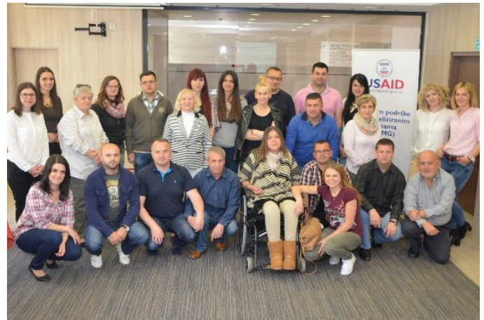
Zajednička fotografija učesnika/ca treninga