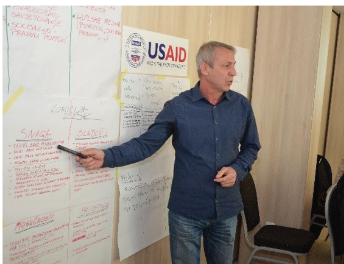
Učesnici prezentiraju rad u grupama

Drugi dan treninga posebna pažnja posvećena je značaju analiza i njihovoj ulozi prilikom kreiranja strateškog plana. Učesnici/e treninga su prilikom grupnog rada i uz trenerovu pomoć definirali ključna pitanja za razvoj organizacija te odredili strateške fokuse i ciljeve.